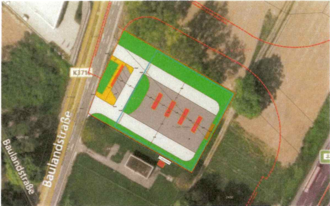
Abbildung 5: Ausschnitt Lageplan Parallelaufstellung mit Schleppkurven (vgl. Anlage 2: Lageplan Parallelaufstellung mit Schleppkurven)