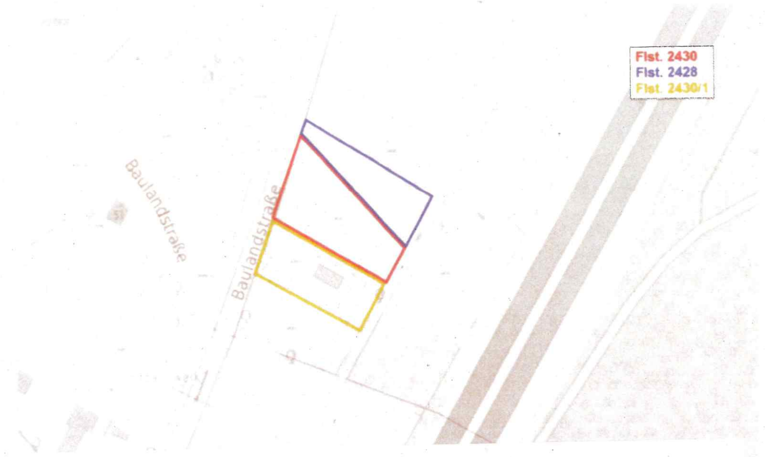
Abbildung 2: Lage im Stadtgebiet